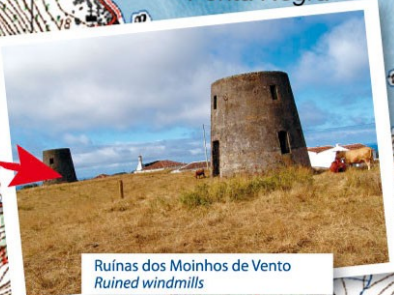
Ruínas dos Moinhos de Vento Ruined windmills