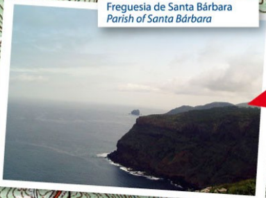
Freguesia de Santa Bárbara Parish of Santa Bárbara