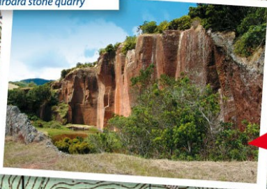
Pedreira de Santa Bárbara Santa Bárbara stone quarry