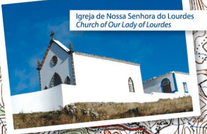
Igreja de Nossa Senhora do Lourdes Church of Our Lady of Lourdes