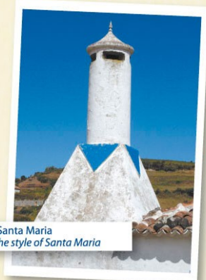
Típica chaminé de Santa Maria Typical chimney in the style of Santa Maria