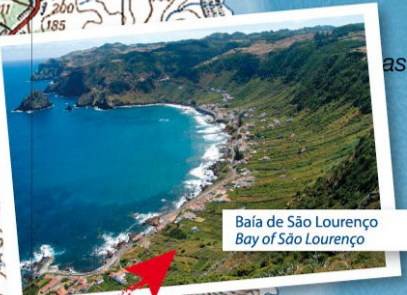
Baía de São Lourenço Bay of São Lourenço