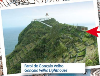
Farol de Gonçalo Velho Gonçalo Velho Lighthouse