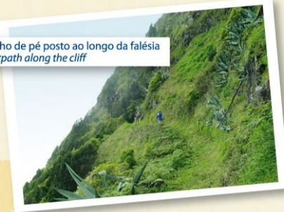
Atalho de pé posto ao longo da falésia Footpath along the cliff

PR2 SMA - Pico Alto - Anjos PRC3 SMA - Entre a Serra e o Mar