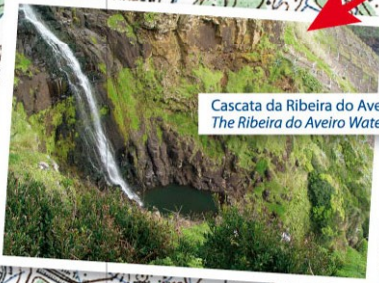
Cascata da Ribeira do Aveiro The Ribeira do Aveiro Waterfall