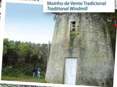
Moinho de Vento Tradicional Traditional Windmill